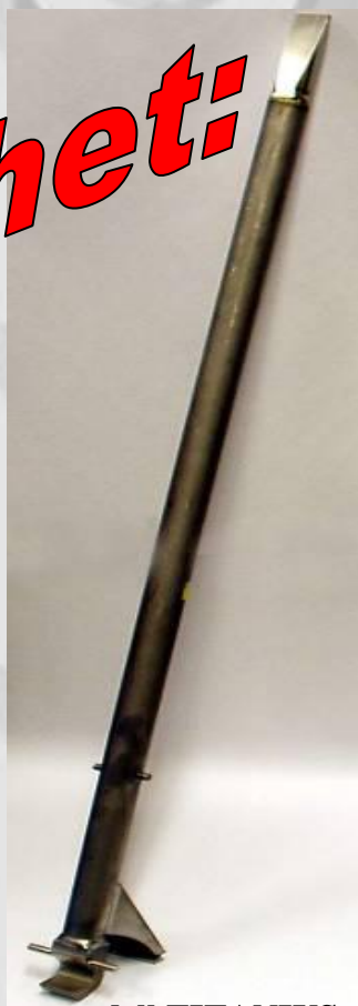
Grunnmodell TITANIUS Art. nr. 8140 Kombinasjonsverktøy 2,4kg