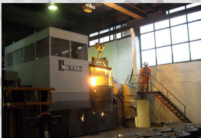
Nye smelteovner for effektiv smelting av jern.

Sommeren 2009 satte vi inn nytt smelleanlegg på Furnes. Anlegget består av smelteovner, chargeringsvogner, bygningsmessige endringer, elektrisk anlegg, etc.