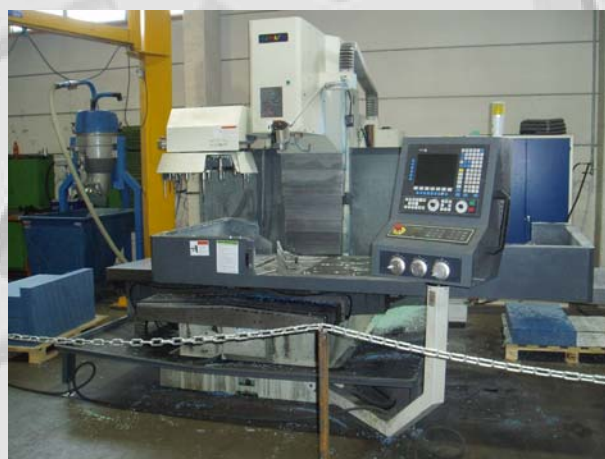
Fresemaskin for avansert modellframstilling av nye og vedlikehold av eldre modeller.

Vinteren 2009 satte vi inn en Bimato 3072R 3-akset fresemaskin. Vi benytter nå 3D DAK modellen direkte i programmeringen av fresemaskinen. Å lage modeller på denne måten er en avansert prosess og våre ansatte har derfor tilegnet seg en betydelig kompetanse i moderne modellfremstilling og programmering. Dette gir oss raskt en nøyaktig modell. På denne måten får vi nå mindre etterbehandling av, og bedre kvalitet på våre produkter.